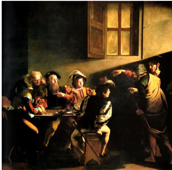
Tableau du Caravage (1571-1610) – église St Louis des Français à Rome