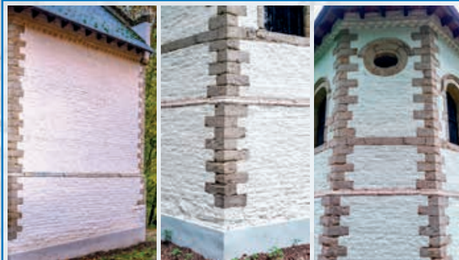
Cordon de pierre en cavet | Chaînage d'angle harpé | Oculus ovale, encadrement des baies sous archivolte, bandeau de pierre, frise dentée au sommet des murs.

La chapelle est une très séduisante construction traditionnelle en brique et en pierre blanche, comprenant une nef simple et un chevet à trois pans, sur un haut soubassement. Le raffinement de la construction se manifeste avec des chaînages d'angle harpés, des encadrements des baies sous archivolte ou encore un portail sculpté de type gothique tardif.